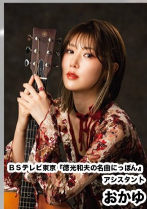
BSテレビ東京『徳光和夫の名曲につぼん』 アシスタント おかゆ